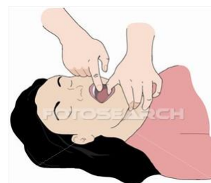
Gambar III. Finger Swab