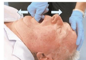
Gambar II. Manuver Chest Thrust