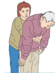
Gambar I Manuver Abdominal Thrust